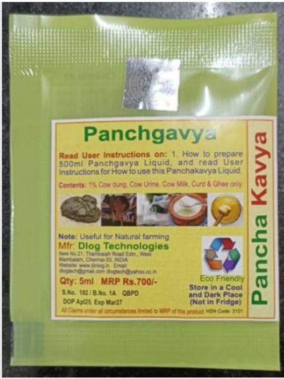
Panchgavya 5ml Pouch model April 25 MRP Rs.700