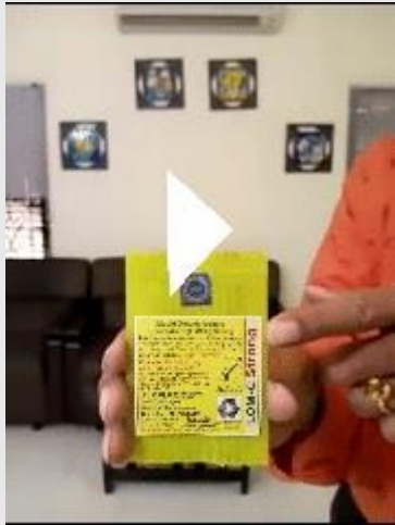
Video of 7.5ml making 750ml LOM https://youtu.be/0ryXejQEIJw