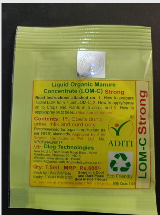
LOM-C Strong 7.5ml Pouch MRP Rs.600