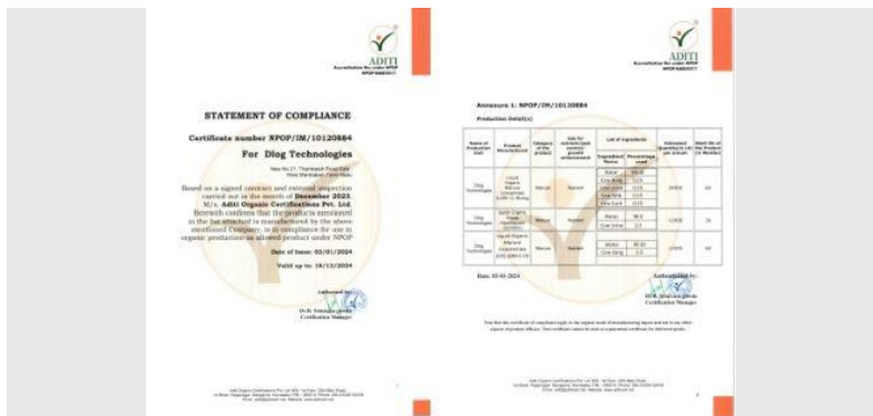
Organic Certification by Aditi Organic Certifications Pvt. Ltd.pdf Click to open